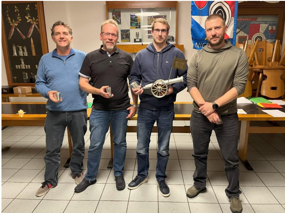
Die vier Erstplatzierten beim Cup-Final